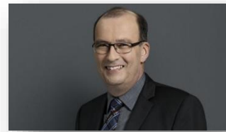
Präsident Schweizerischer Bauernverband Nationalrat Markus Ritter